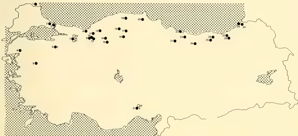
Abb. 1: Fundorte von Megabombus pascuorum (Scopoli, 1763) aus dem anatolischen Gebiet.

Die Fundorte sind in Abb. 1 zusammengestellt. In diesen Lokalitäten wurde pascuorum ab Meereshöhe (zwischen Ünye und Fatsa) bis zur Baumgrenze (im Ilgaz dağı bei 2000 m Meereshöhe) festgestellt.